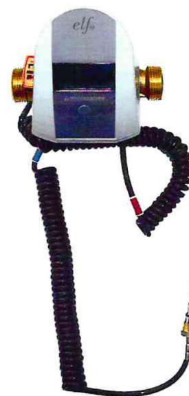
Рисунок 2 - Внешний вид теплосчетчика